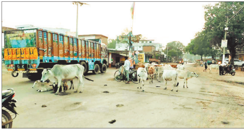
चौक पर मवेशियों का झुंड।

मानीचौक क्षेत्र में इस दिनों आवारा मवेशियों की संख्या काफी बढ़ गई है जो दिन भर जंगल व मुख्य मार्ग एवं चौक चौराहों में रहते हैं और शाम ढलते ही किसानों खेतों में पहुंच कर धान की बाली को खाकर बर्बाद कर दे रहे हैं। किसानों ने बताया कि ग्राम पोड़ी, सलका, डेडरी, सपकरा,मानी में आवारा मवेशी सैकड़ों की संख्या में क्षेत्र