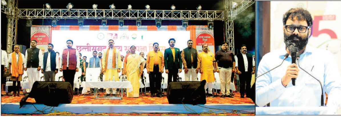
रणजीता स्टेडियम में राज्योत्सव 2025 का भव्य आयोजन।